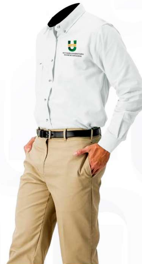
UNIFORME formal caballeros

El Isologo debe estar ubicado en todo momento al lado izquierdo del pecho.