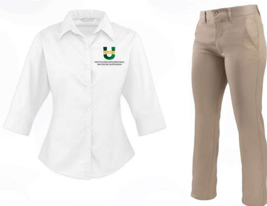
UNIFORME formal damas

El Isologo debe estar ubicado en todo momento al lado izquierdo del pecho.