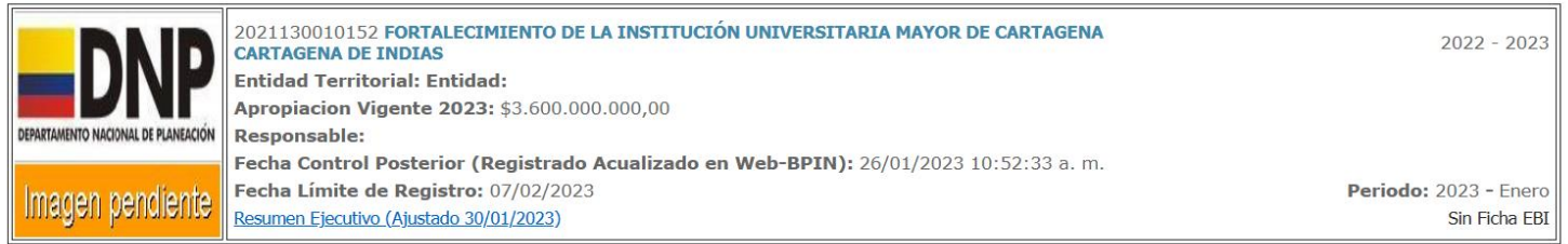
Imagen Cargar Resumen Ejecutivo (Actualizar Borrar)