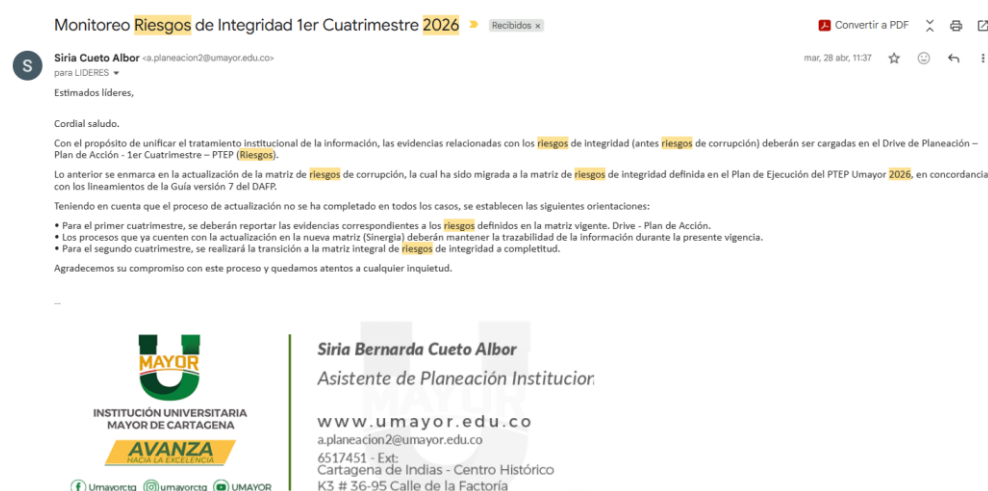
Ilustración 1 Correo Notificación monitoreo riesgos período

Con el propósito de fortalecer la gestión institucional del riesgo, se solicitó a los líderes de proceso, mediante correo electrónico, el cargue de evidencias de controles en el Drive de Planeación (Plan de acción); de igualmente se les invito a espacios participativos (mesas de trabajo) para la revisión, validación y actualización de los riesgos identificados.