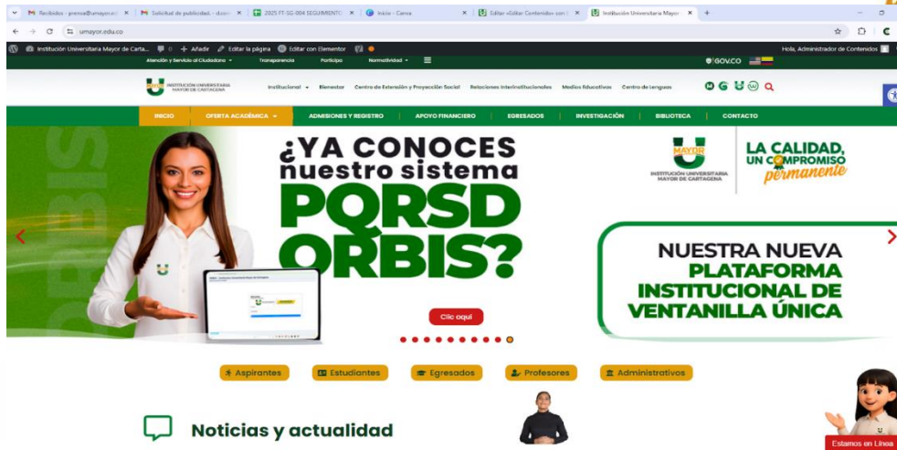
Ilustración 9 Invitación y asistencia para la promoción de los canales de PQRSD