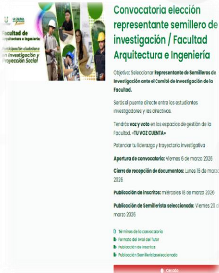
Ilustración 12 Convocatoria consulta elección representante de semillero de investigación (Fac. Arquitectura e Ing.)