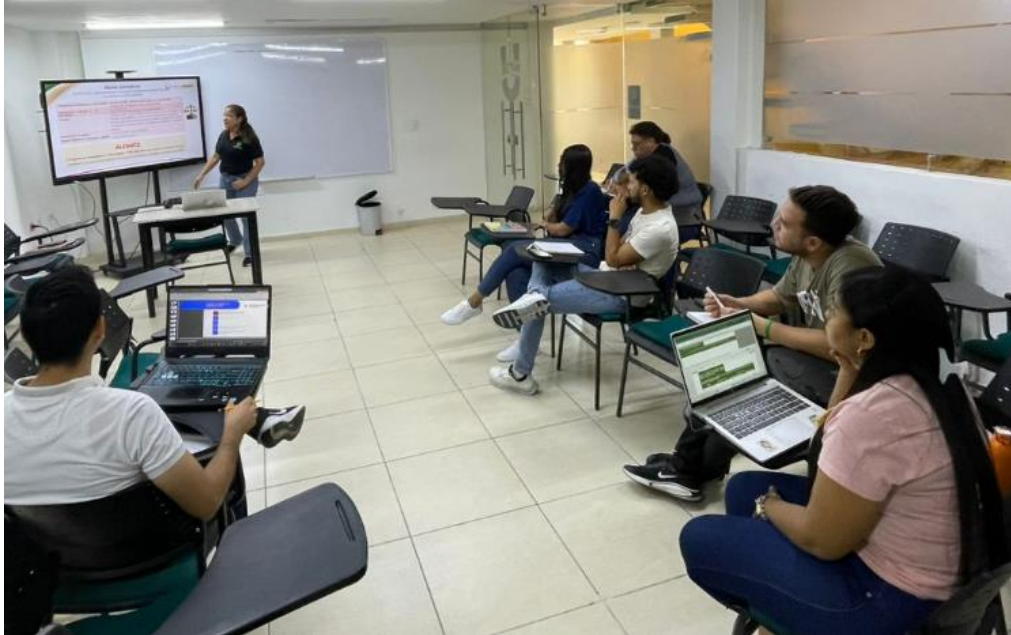
Ilustración 6 Reunión Equipo Técnico de Riesgos Integrales – Fecha 25 Feb. 2026

Asimismo, se inició el proceso de fortalecimiento institucional frente a nuevas tipologías de riesgos incorporadas en el PTEP 2026, incluyendo riesgos asociados a corrupción, fraude, conflicto de interés, riesgos fiscales, LA/FT/FPADM y seguridad de la información.