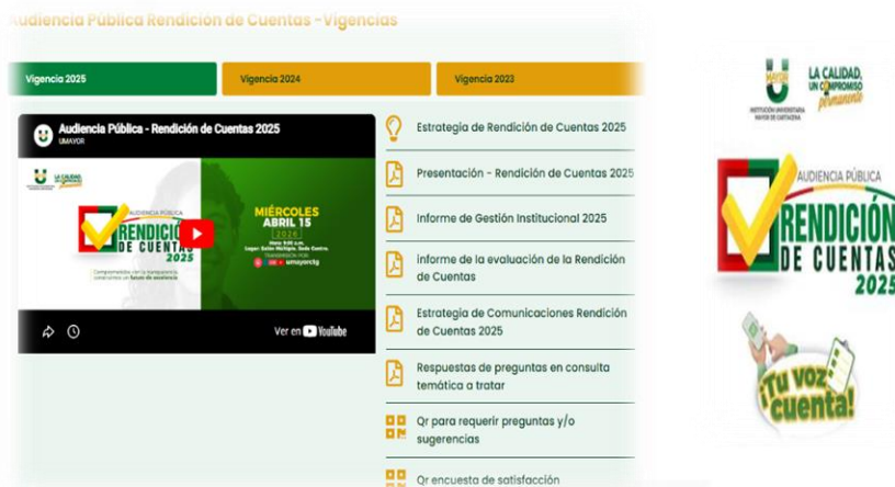
Ilustración 14 Audiencia Pública de rendición de cuentas