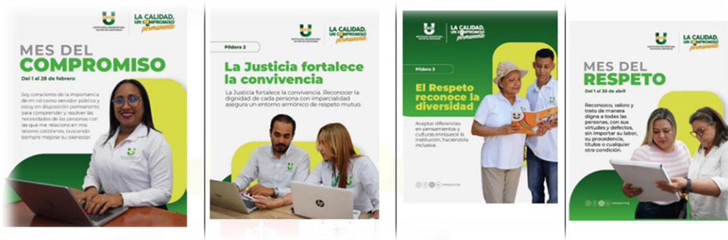
Ilustración 11 Campañas de socialización Código de Integridad