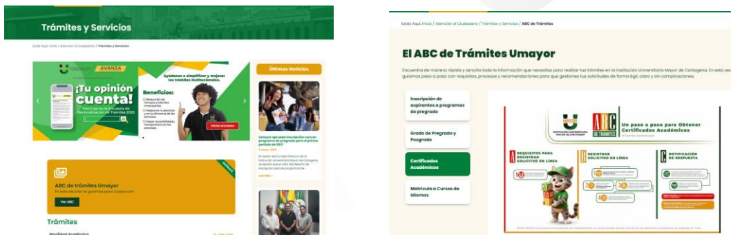
Ilustración 15 Acciones de racionalización de tramites publicadas en página web institucional