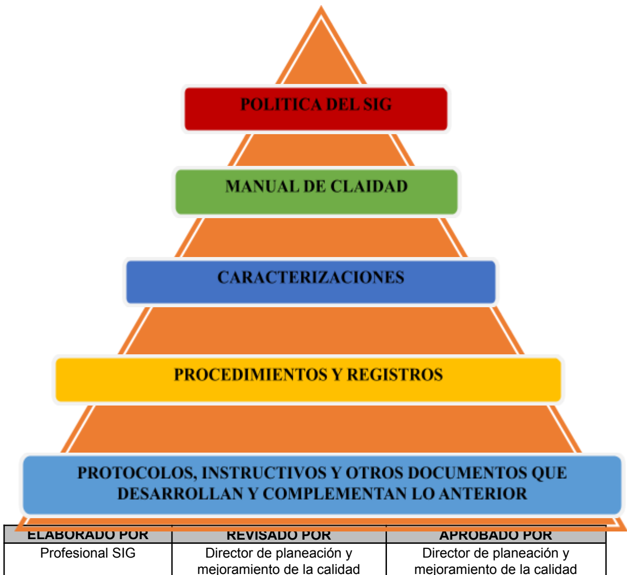
Figura 1. Pirámide de la documentación

Los documentos que son parte fundamental del Sistema Integrado de Gestión se clasifican en cinco niveles de acuerdo a su responsabilidad y control. (Véase figura1)